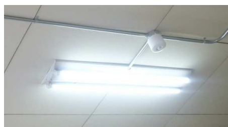
人感センサー+LED照明