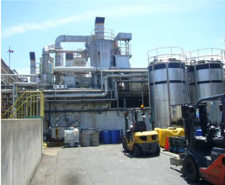
写真は 2017.6.14 株式会社ダイセキ様(優良産廃処理業者認定取得)の視察時の風景