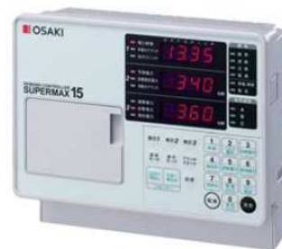
デマンドコントローラ

当社は、通年の電力ピークである7月から9月の電力ピーク値をカットするため、デマンドコントローラ(監視装置)による管理を実施しています。