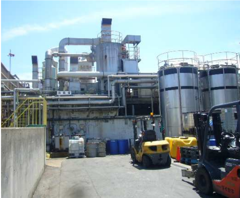
写真は 2017.6.14 株式会社ダイセキ様(優良産廃処理業者認定取得)の視察時の風景