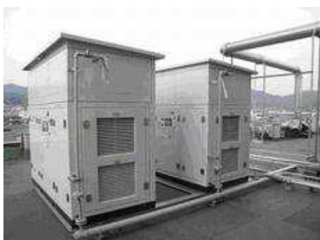
インバータコンプレッサ