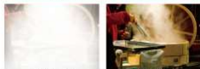
従来のマルチコート