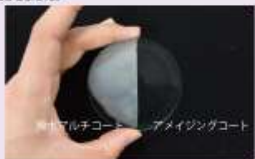
標準マルチコート アメイジングコート

アメイジングコートは、水をはじくのではなく、乾燥させるという、従来の撥水マルチコートとは全く逆の発想から生まれた、レンズの曇りを防ぐコートです。高い親水性を持つコート膜を、専用メガネ拭きで拭くだけで、優れた防曇効果と、高い持続性を実現させました。