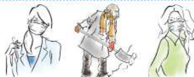
マスク着用期間の長い方 (技術者、看護師の方など)